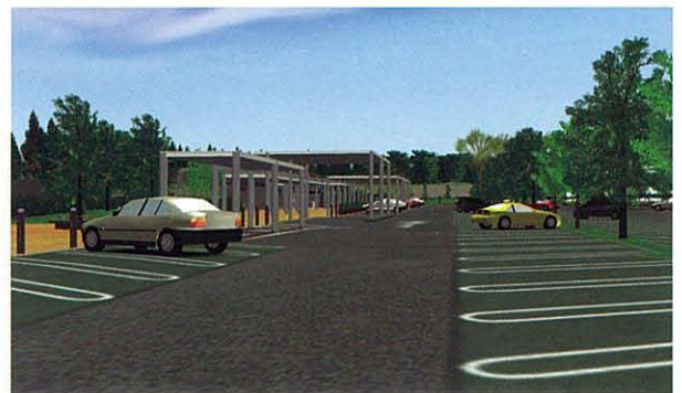
同じ場所から、高さ10mの視点(上)と大人の目線(下:1.5m)周辺景観を含めた視認性検討が簡単にできます。