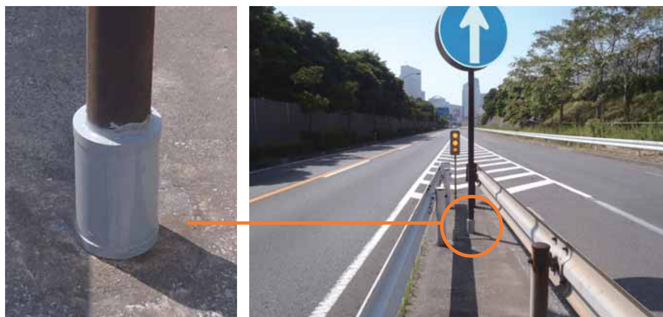
標識柱への取付け例