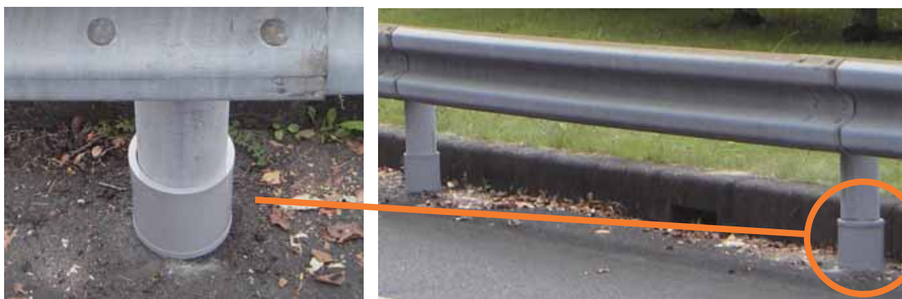
防護柵支柱への取付け例

ガードレール支柱、照明柱、標識柱などの地際部では、マクロセル腐食が見られます。最近では、トラス橋の斜材等でもマクロセル腐食が問題となっています。“柱護郎”は、簡単な施工でマクロセル腐食を防ぎ、LCCの低減と維持管理の省力化に貢献します。