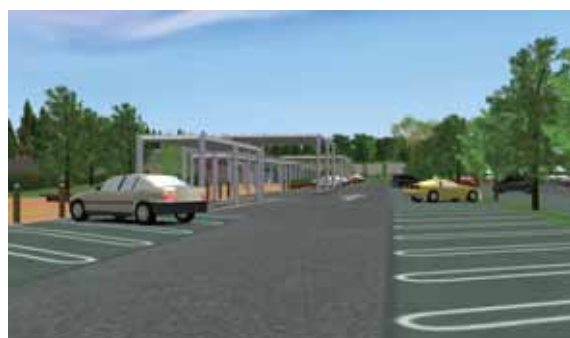
同じ場所から、高さ 10m の視点 (上) と大人の目線 (下：1.5m) 周辺景観を含めた視認性検討が簡単にできます。