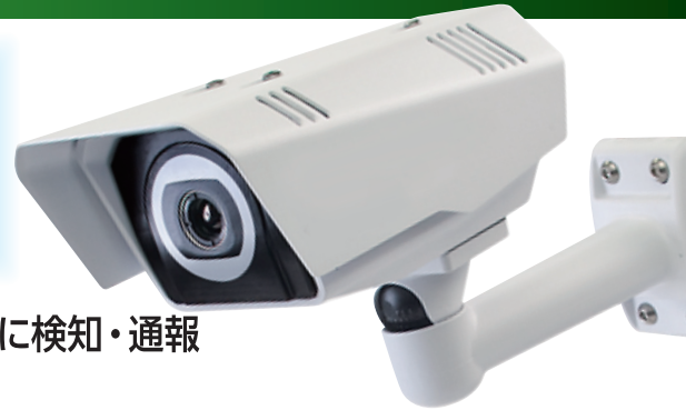
赤外線サーマルカメラ